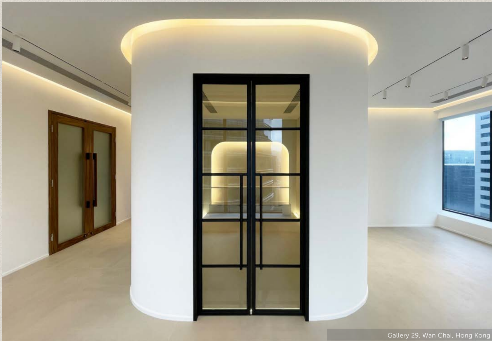
Gallery 29, Wan Chai, Hong Kong

ミニマリズムからマキシマリズムまで、さまざまなクライアントの要望を実現するHintegroは、機能的で美しい住空間を創造するデザイン事務所として、その先頭を走っています。