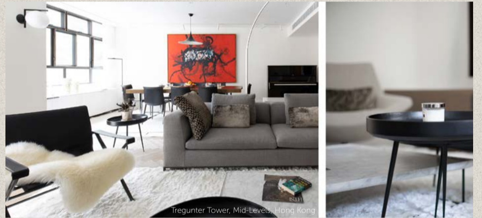
Tregunter Tower, Mid-Levels, Hong Kong