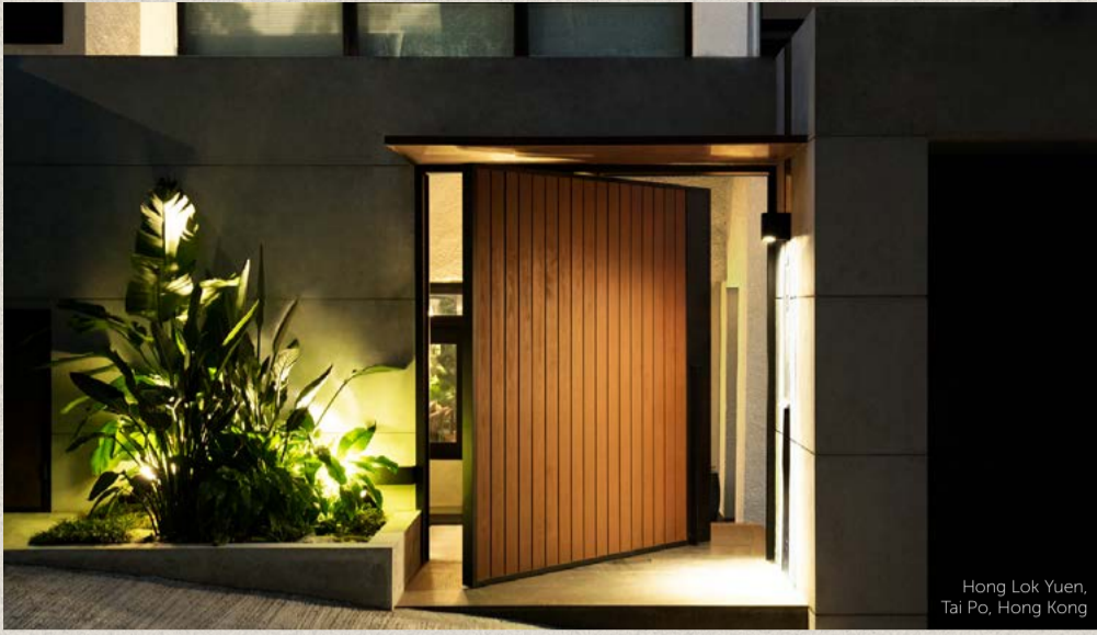
Hong Lok Yuen, Tai Po, Hong Kong

近年、住宅デザインは、美しさと機能性を兼ね備えた空間づくりを追求するという新たな次元の重要性をもっています。ミニマリズムやマキシマリズム、天然素材や大胆な色使いなど、あらゆるテイストや住まいにマッチするトレンドがあります。そして、より速く、より高い要求が求められる私たちの生活が、家は単なる生活の場ではなく、私たちがくつろぎ、再充電できる、快適でリラックスできる聖域となりました。