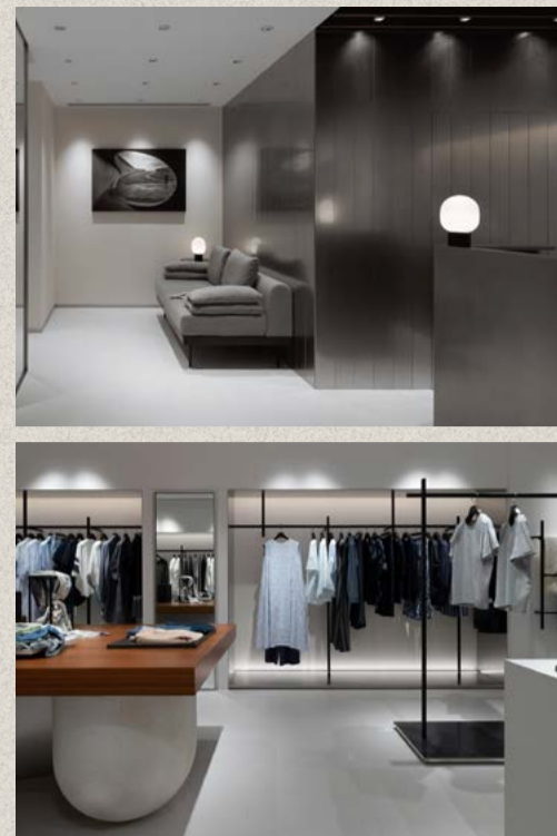
香港のフェスティバルウォークにあるAtsuro Tayamaのショップは、Hintegroによるデザインです。自然素材とモダンな美学が絶妙なバランスで融合した優雅で洗練された店舗です。