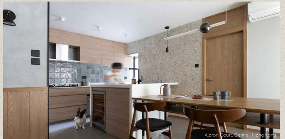
Albron Court, Central, Hong Kong