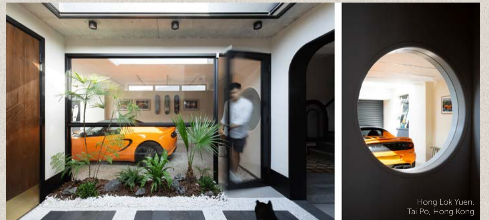
Hong Lok Yuen, Tai Po, Hong Kong