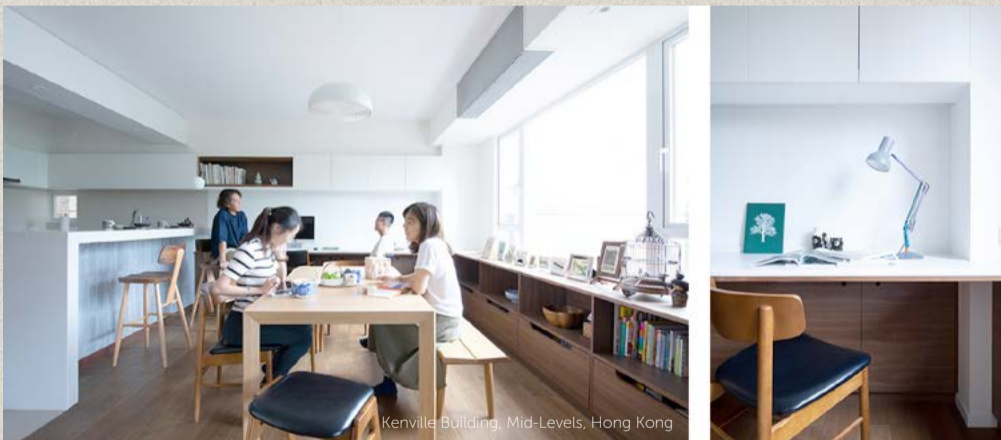
Kenville Building, Mid-Levels, Hong Kong